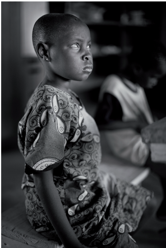
Institut National des Aveugles Bamako. Mali. Marzo 2012.

Impresión digital b/n sobre papel Hahnemühle Photo Rag Baryta. 70 x 50 cm.