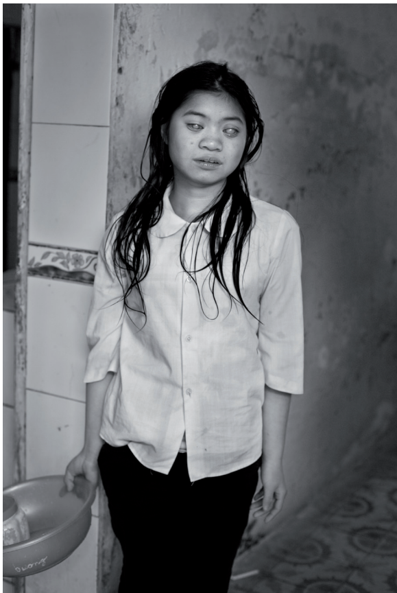
Blind School Nguyen Dinh Chieu of Hanoi. Vietnam. Enero 2011.

Impresión digital b/n sobre papel Hahnemühle Photo Rag Baryta. 70 x 50 cm.