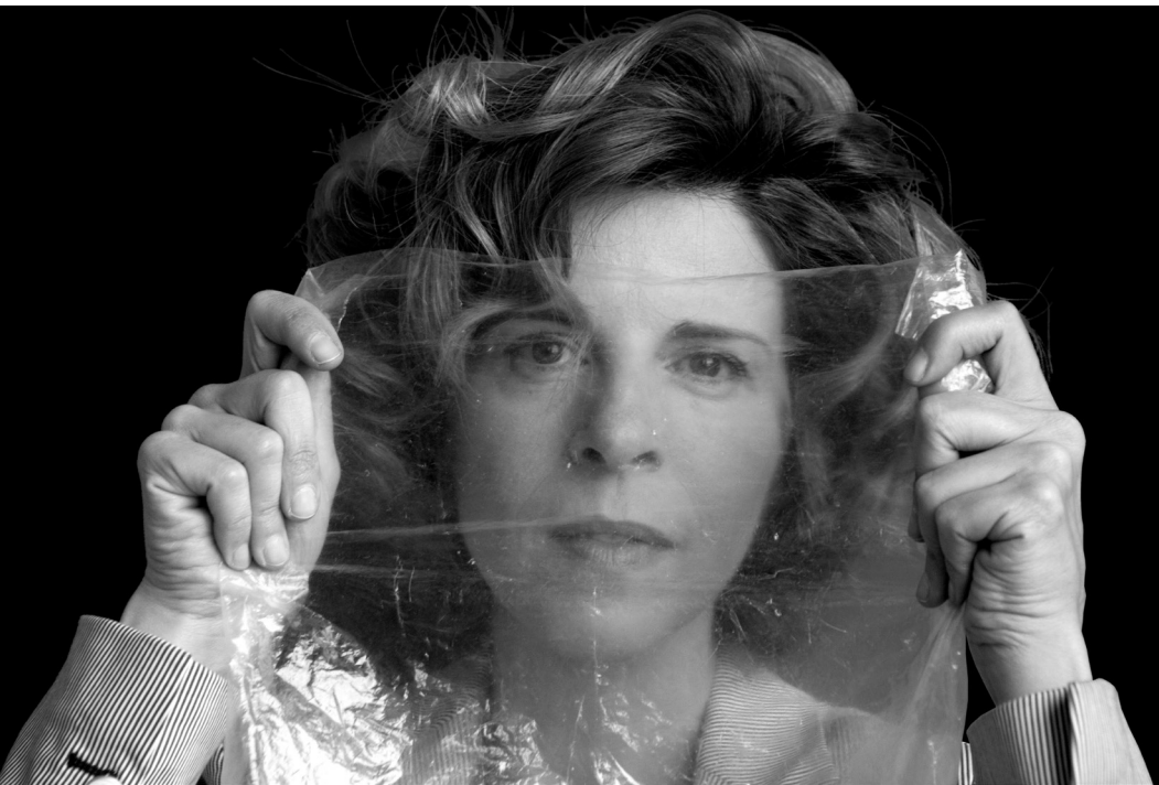
Sole Giménez. Cantante. 2011. Relieve fotográfico. Didú. 80 x 120 cm.