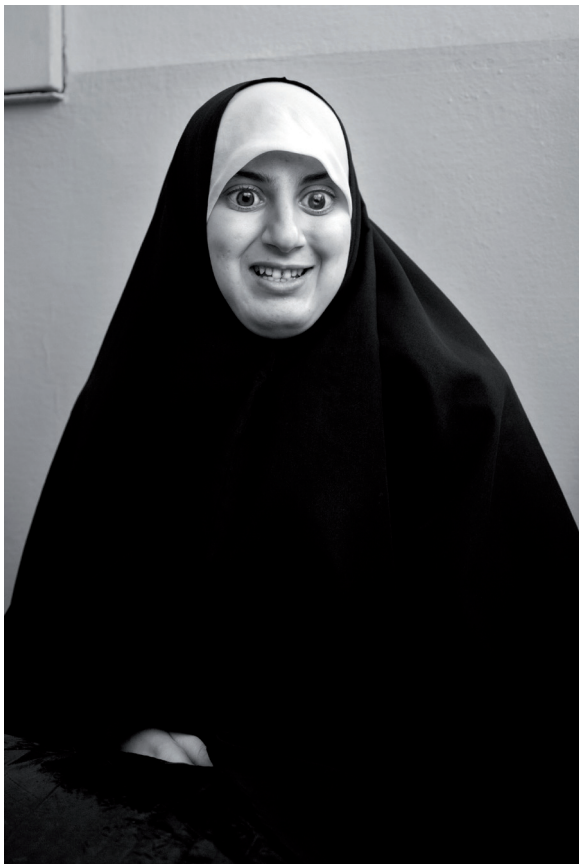
Colegio para niños ciegos de Tetuán. Marruecos. Mayo 2011.

Impresión digital b/n sobre papel Hahnemühle Photo Rag Baryta. 70 x 50 cm.