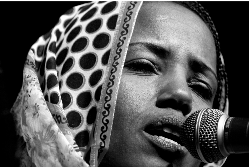
Aziza Brahim. Cantante Saharaui. 2010. Relieve fotográfico. Didú. 80 x 120 cm.