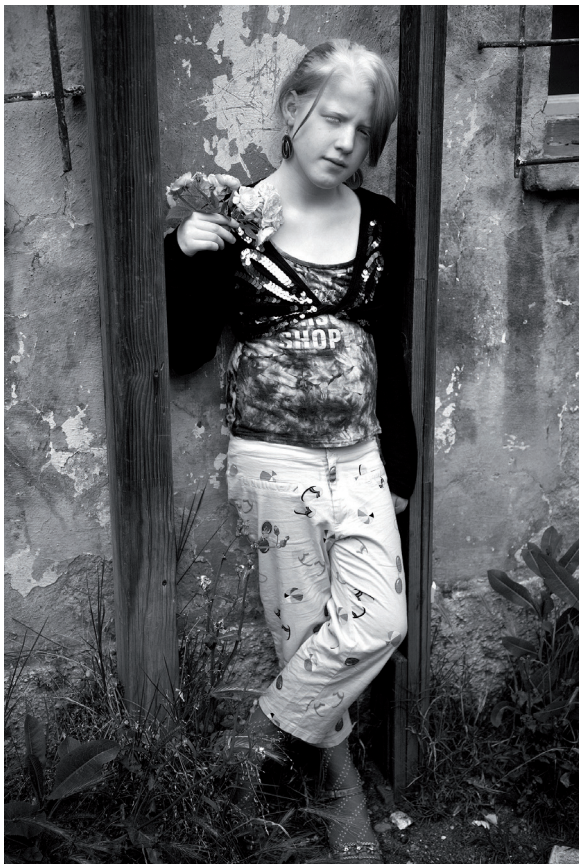
Instituto Verderve per MX.Nuk Shiicajne Tirana. Albania. Mayo 2011.

Impresión digital b/n sobre papel Hahnemuhle Photo Rag Baryta. 70 x 50 cm.