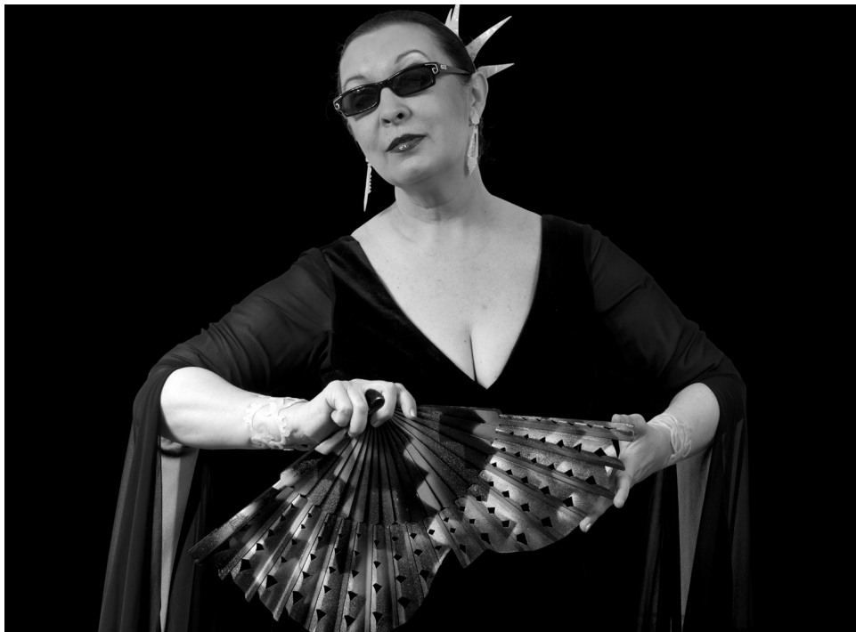
Martiro. Cantante. 2011. Relieve fotográfico. Didú. 87 x 120 cm.