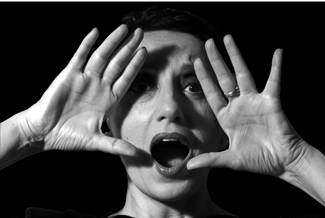
Luz Casal. Cantante. 2011. Relieve fotográfico. Didú. 80 x 120 cm.